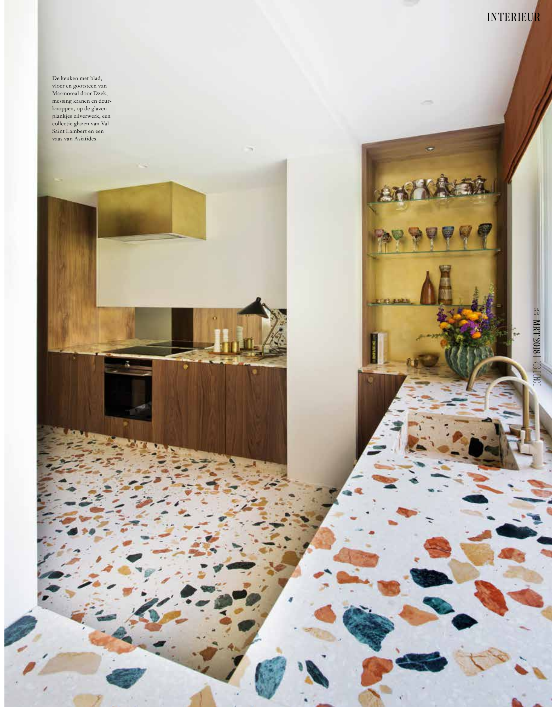
De keuken met blad, vloer en gootsteen van Marmoreal door Dzck, messing kranen en deurknoppen, op de glazen plankjes zilverwerk, een collectie glazen van Val Saint Lambert en een vaas van Asiatides.