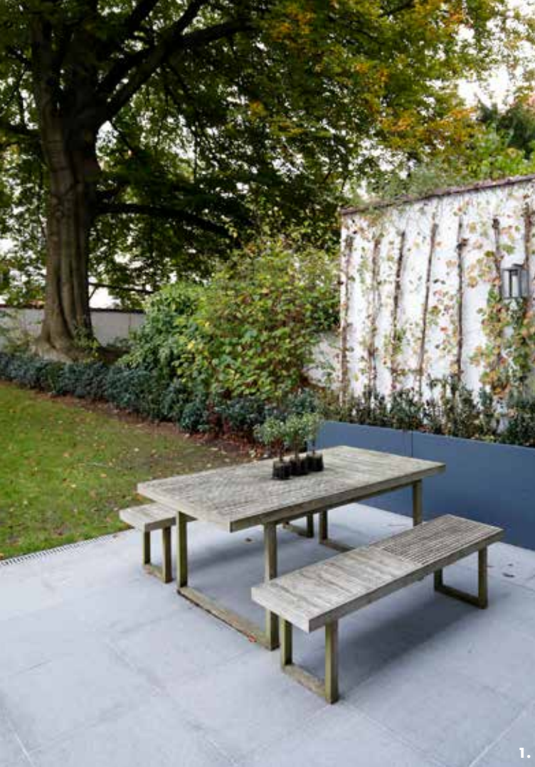
1. 2. 3.