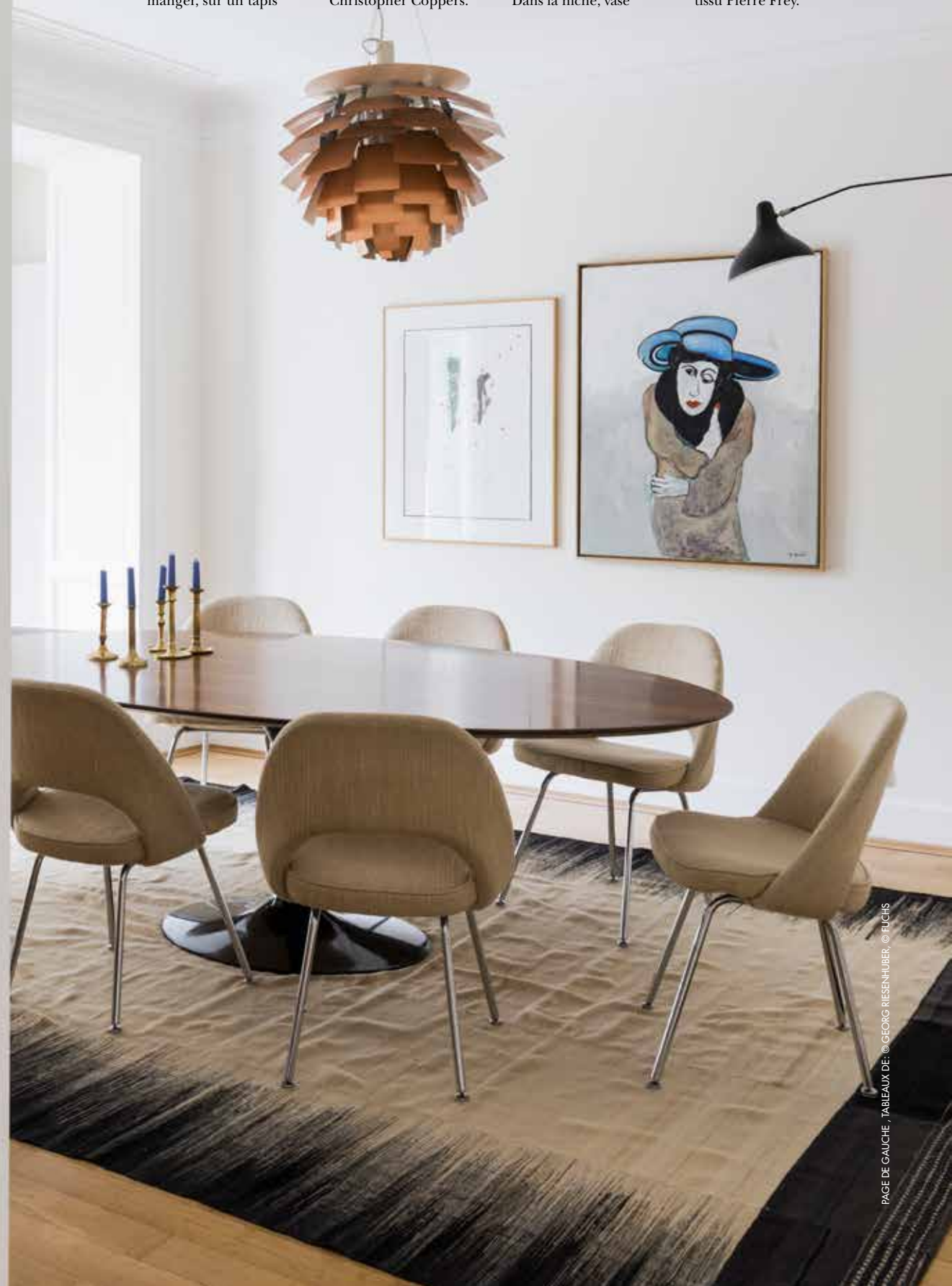
PAGE DE GAUCHE : TABLEAUX DE : © GEORG RIESENHUBER © FUCHS

Asiatides, verres Val Saint Lambert et collection de théières. Au-dessus des tabourets de Charles & Ray Eames, lampe «Hanging Lamp 1» de Muller van Severen. Table chinée et pots en laiton Ferm Living. Store en tissu Pierre Frey.