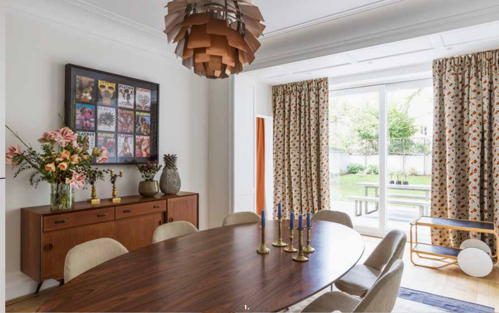
1. 2. 3.